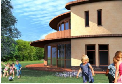
KINDERDAGOPVANG DE CRISTALLIJN, LENT