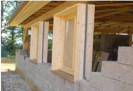
BOUWEN MET HENNEPBLOKKEN