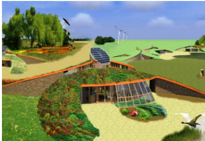
ONTWERP AUTARKISCHE LANDWONING