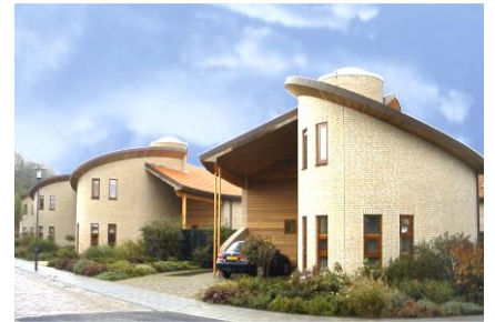
5 ECO-WONINGEN RIJEN