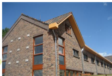
23 WONINGEN GILZE

Gebouwen moeten een positieve invloed hebben op de gezondheid van de gebruiker. Het toepassen van ecologische, niet schadelijke materialen is hierbij essentieel. Materialen dienen in hun volledige kringloop te worden beschouwd alvorens de juiste keuze te kunnen maken. Ook de invloed van de materiaalkeuze en de ontwerpuitgangspunten op de energiehuishouding is erg belangrijk voor het ontwerpen van duurzame, energiezuinige of zelfs energieneutrale woningen en gebouwen.