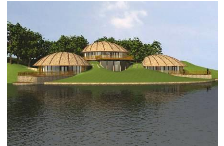
3 AUTARKISCHE WONINGEN APELDOORN