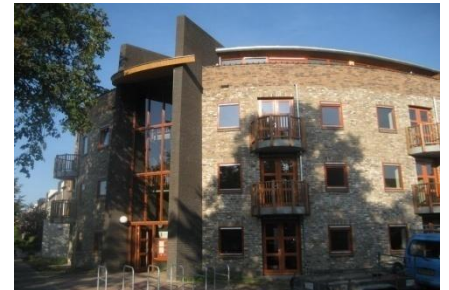
19 APPARTEMENTEN RIJEN

Om een kwalitatief goed bouwproject te kunnen realiseren moeten de betrokken partijen optimaal met elkaar samenwerken, gek zijn van bouwen (bezieling) en plezier in het werk hebben. Hiervoor dienen alle partijen in een vroeg stadium betrokken te worden bij het ontwerp. Door een integrale ontwerpbenadering ontstaat een gebouw waarin de verschillende bouwkundige disciplines elkaar versterken. Door het vooraf formuleren van gemeenschappelijke doelen ontstaat een relatie tussen de verschillende partijen die gebaseerd is op respect, vertrouwen en betrokkenheid.