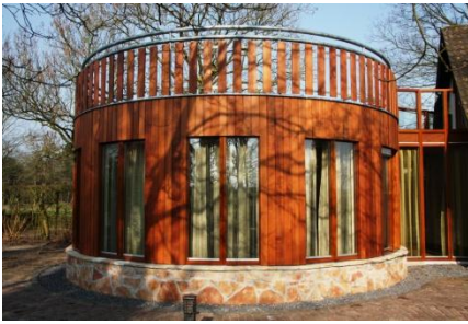
AANBOUW WONING MOLENSCHOT