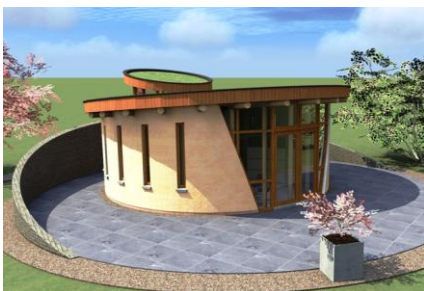
PRAKTIJKRUIJTE NIEUW-EN SINTJOOSTRAND