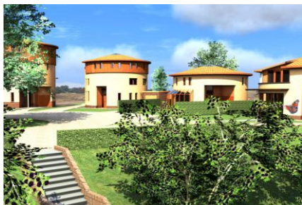
ONTWERP LANDGOED LAGE LIER

“ Een autarkisch gebouw is zelfvoorzienend. Dit betekent dat een gebouw niet afhankelijk is van andere gebouwen of constructies maar zelf voorziet in haar behoeftes aan een gezond binnenklimaat, water, energie, voedsel en milieu. Autarkische architectuur schept de mogelijkheid op een duurzame manier te voorzien in de behoeftes van de mens. Het voldoen aan die behoeftes kan door het nemen van allerlei verschillende maatregelen zoals zonnepanelen, het opvangen van regenwater etc. Autarkische architectuur ontstaat echter pas indien deze maatregelen onderdeel worden van de architectuur van een gebouw. Dit betekent dat deze maatregelen de vormgeving van het gebouw beïnvloeden. Sterker nog: ze worden onderdeel van de architectuur.