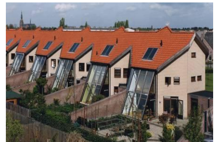
8 ECOLOGISCHE WONINGEN RIJEN