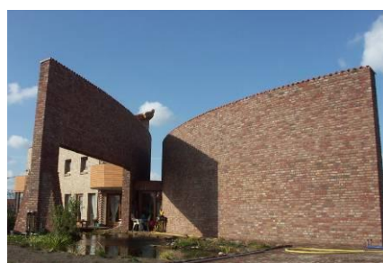
WOONHUIS MET KANTOOR EN WERKPLAATS

Gebouwen moeten een positieve invloed hebben op de gezondheid van de gebruiker. Het toepassen van ecologische, niet schadelijke materialen is hierbij essentieel. Materialen dienen in hun volledige kringloop te worden beschouwd alvorens de juiste keuze te kunnen maken. Ook de invloed van de materiaalkeuze en de ontwerpuitgangspunten op de energiehuishouding is erg belangrijk voor het ontwerpen van duurzame, energiezuinige of zelfs energieneutrale woningen en gebouwen.