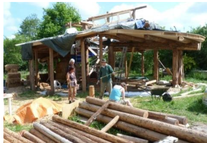
ECO DORP BRABANT