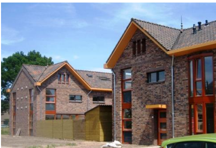
23 WONINGEN GILZE