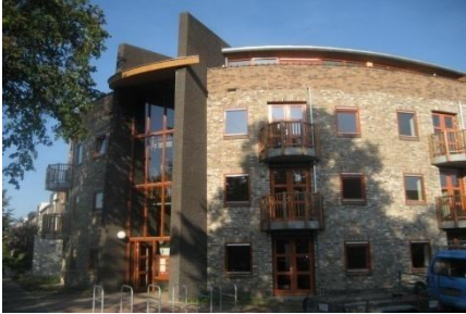
19 APPARTEMENTEN RIJEN