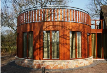
AANBOUW WONING MOLENSCHOT