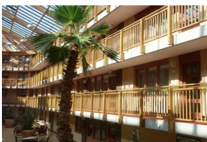
ATRIUM VAN DE ARK RIJEN