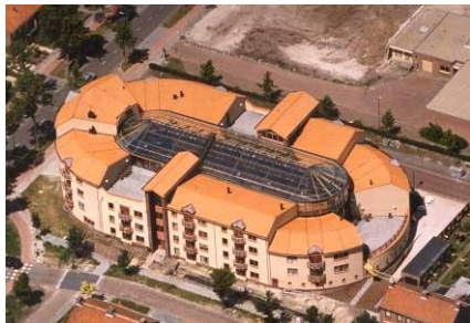
38 APPARTEMENTEN VOOR OUDEREN MET ATRIUM