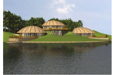
3 WONINGEN APELDOORN