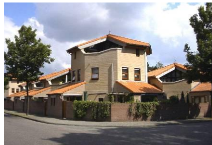
15 WONINGEN MET PLEIN RIJEN